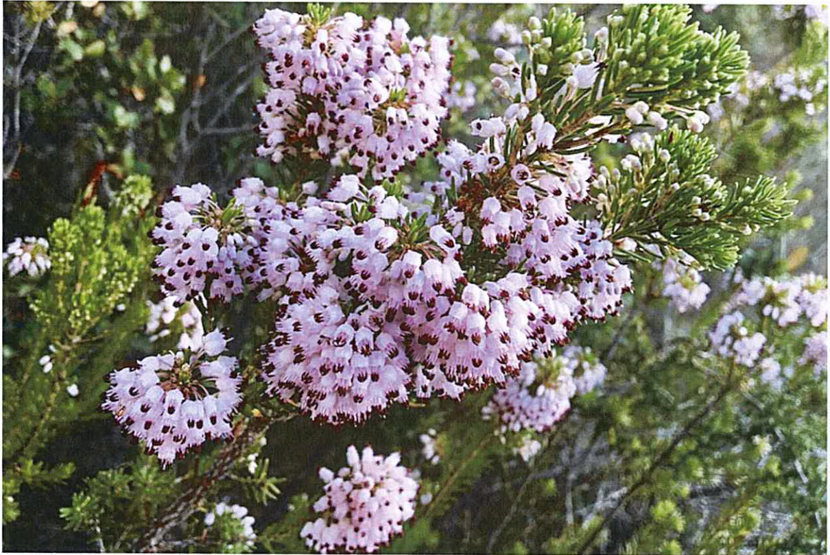
Bruyère multiflore à conserver avec si possible aucune intervention sur ces individus