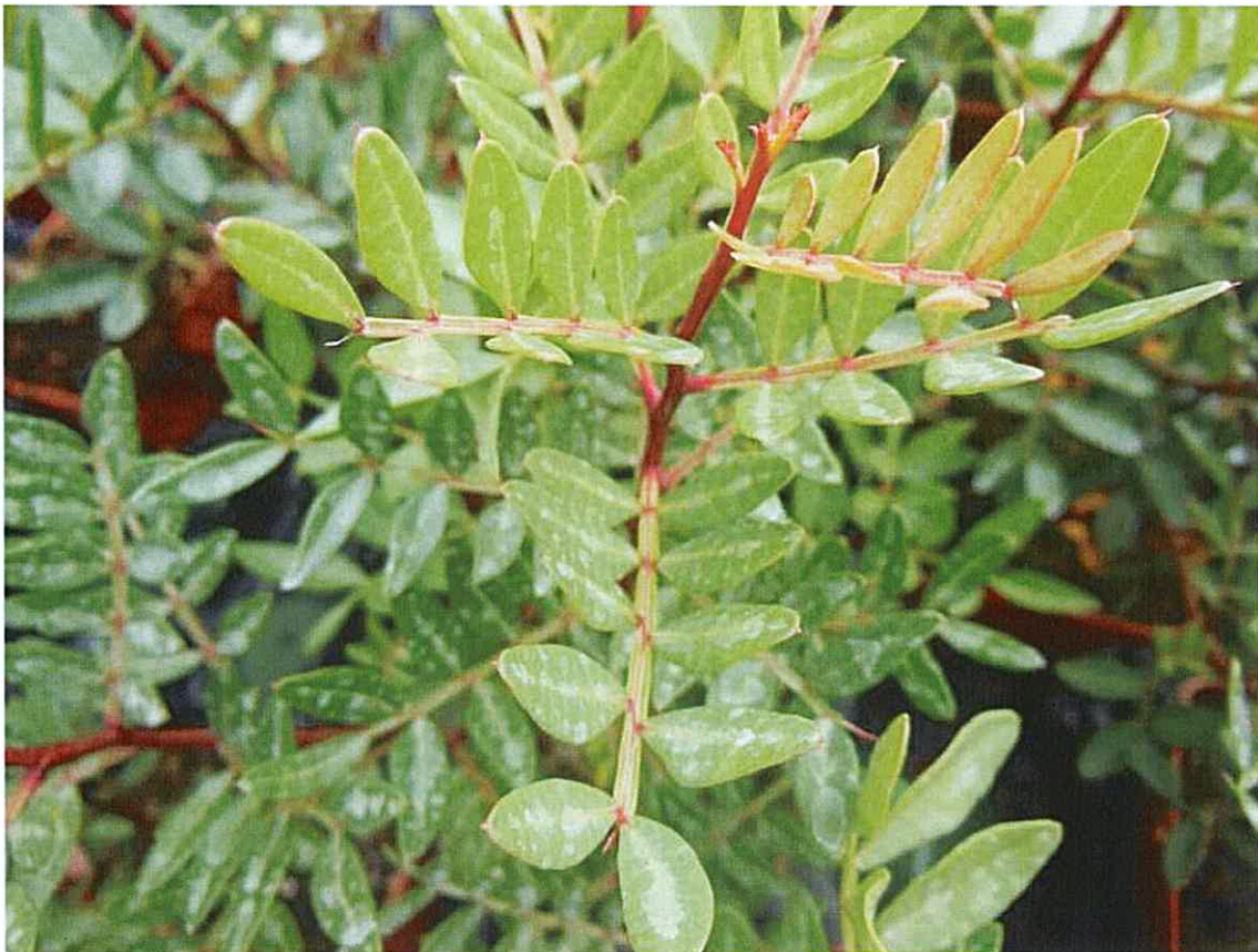
Pistachier lentisque à conserver avec si possible aucune intervention sur ces individus