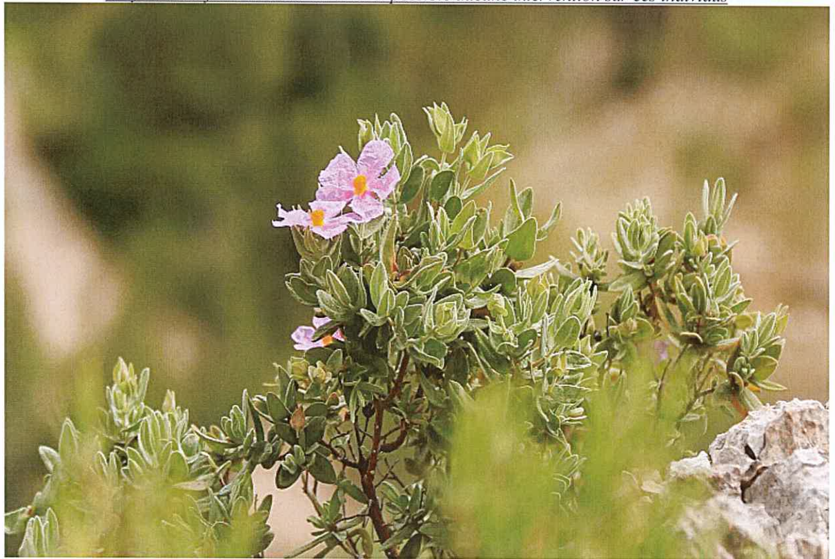
Cistes cotonneux à conserver avec si possible aucune intervention sur ces individus