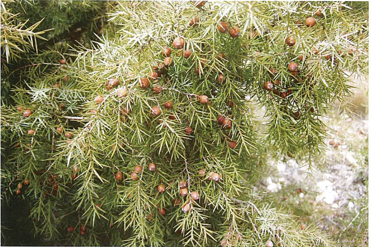
Genévrier cade à conserver avec si possible aucune intervention sur ces individus