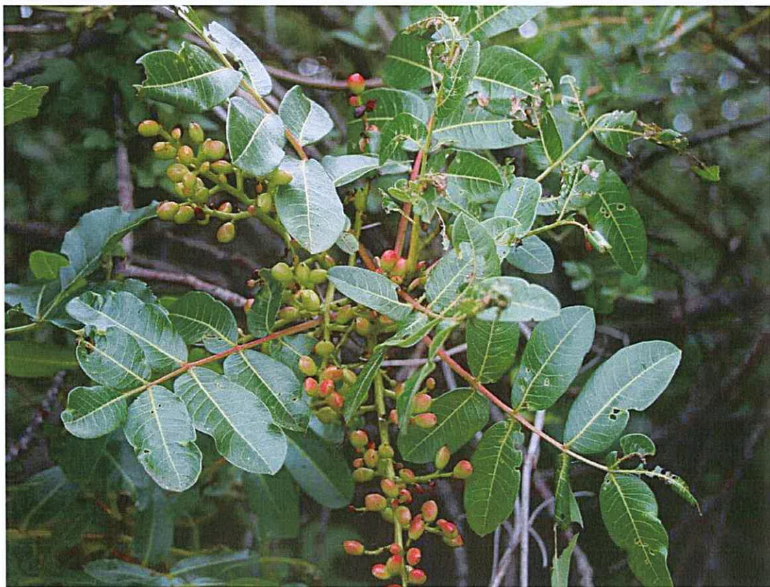
Pistachier terebinthe à conserver avec si possible aucune intervention sur ces individus