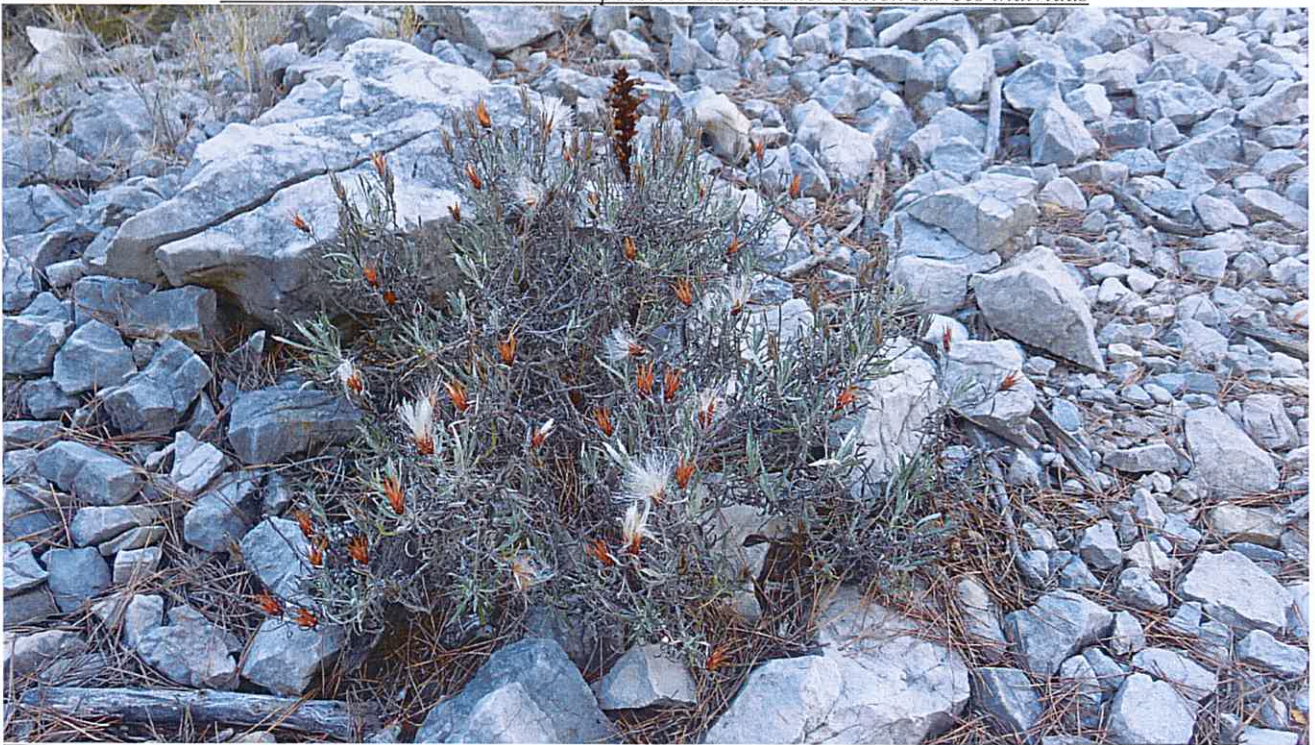
Staehelinae dubia, espèce locale plante hôte de l'Orobanche staehelinae (espèce endémique du parc national des Calanques)