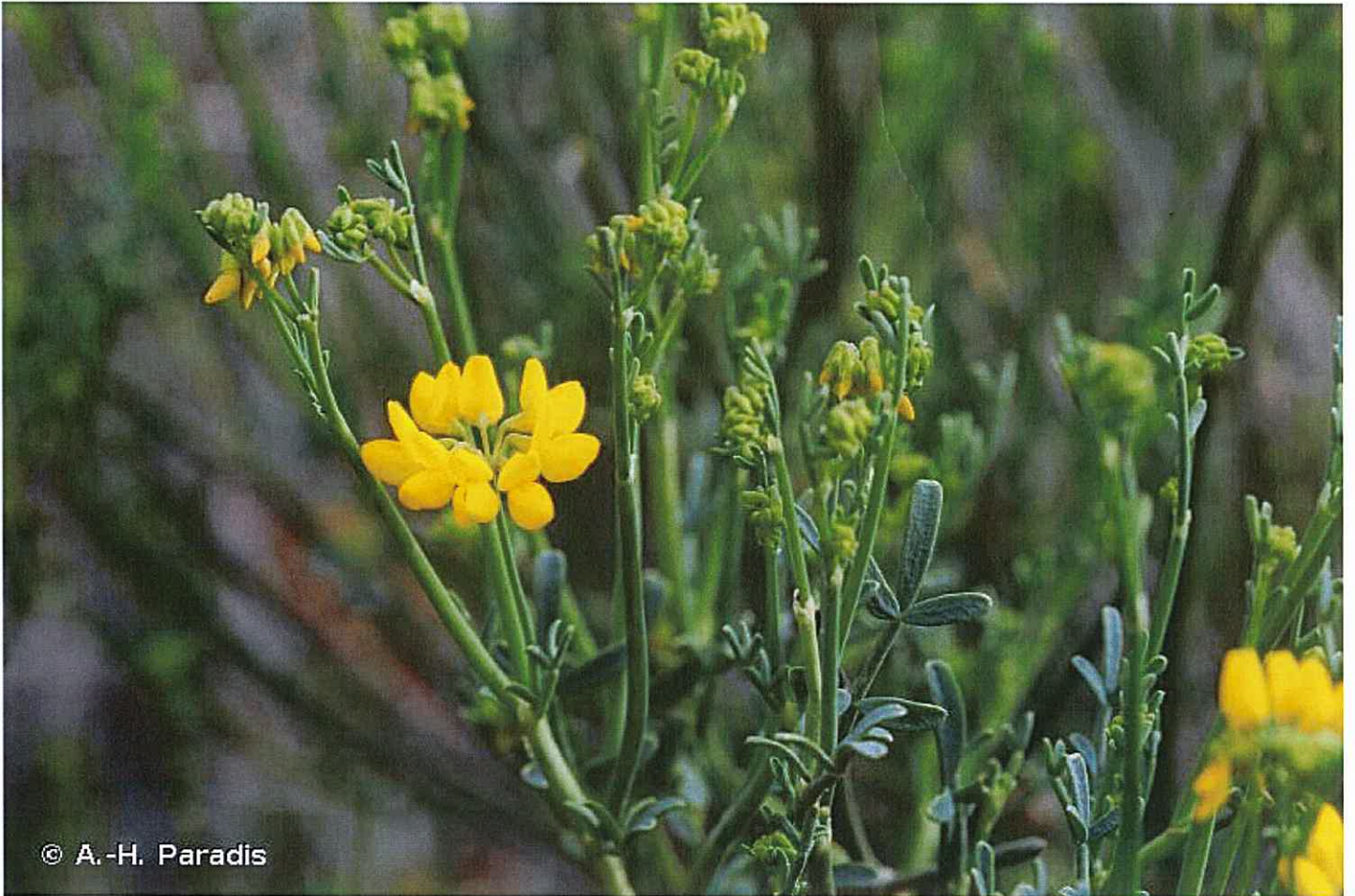
Coronille à tige de jonc, espèces locales à conserver préférentiellement