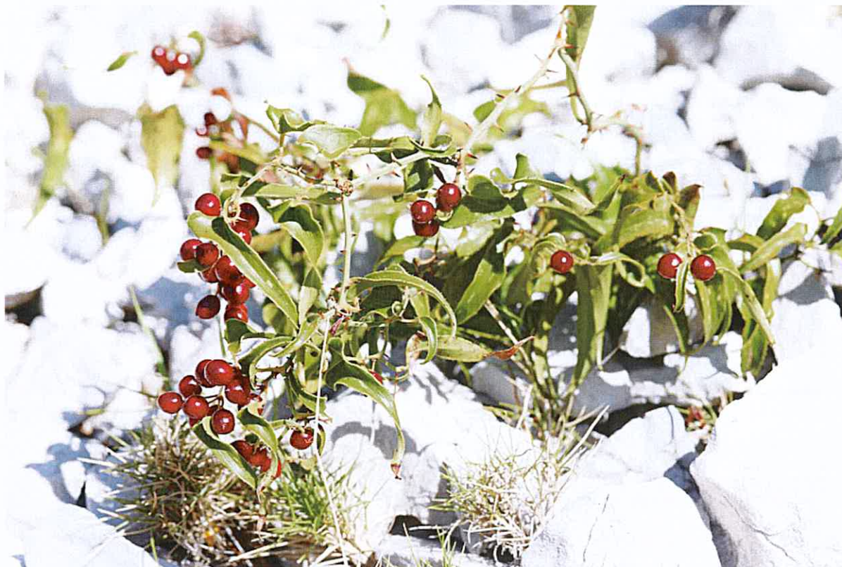
Salsepareille liane locale à conserver avec aucune intervention