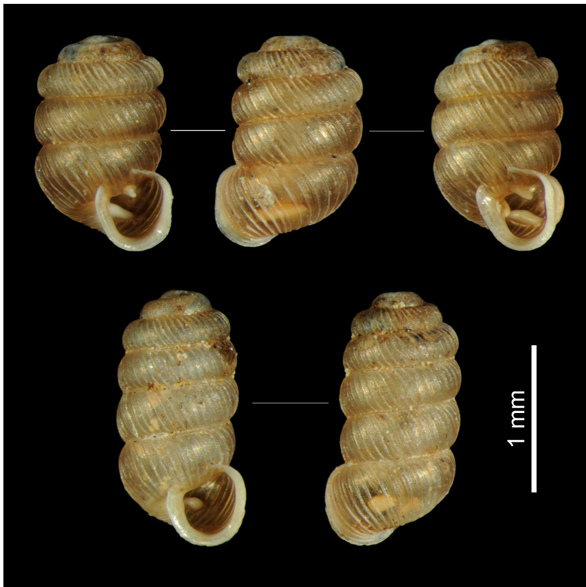
Figure 2 : Truncatellina en syntopie, vallon de la Gineste, Parc national des Calanques. Haut : T. beckmanni, MNHN-IM- 2018-14677 ; bas : T. callicratis, MNHN-IM- 2018-14678